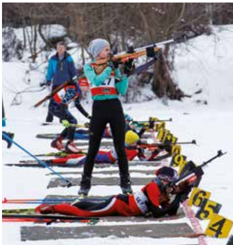
Súťažilo sa v Areáli zimných športov