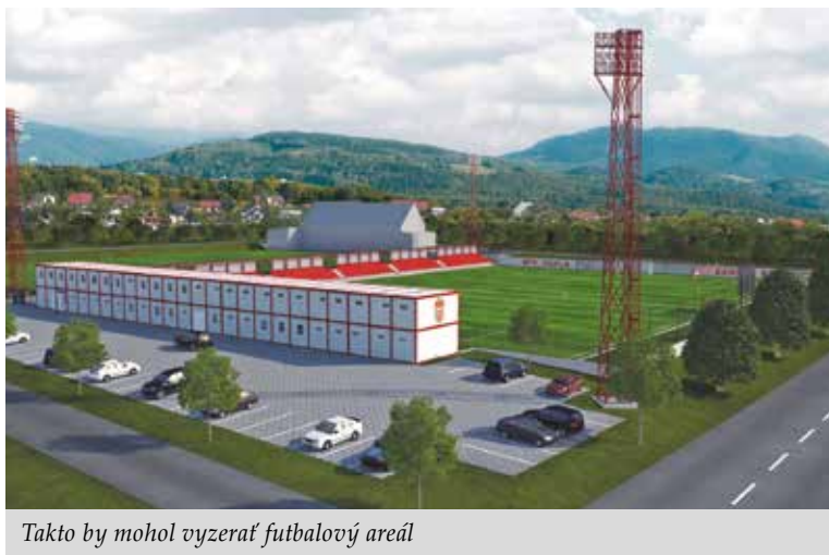
Takto by mohol vyzeráť futbalový areál