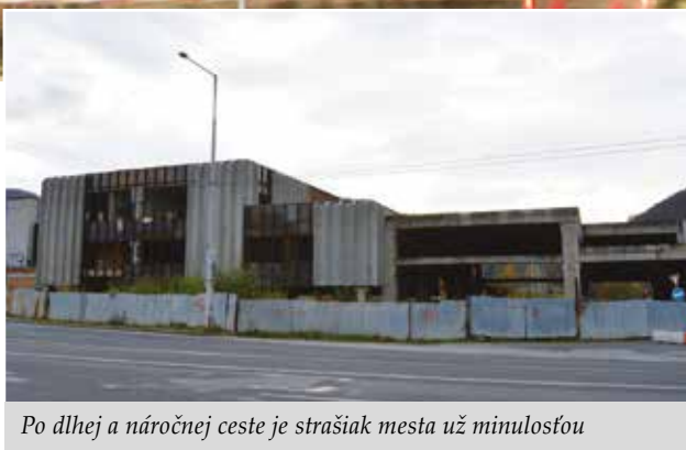
Po dlhej a náročnej ceste je strašiak mesta už minulosťou

Spoločnosť Primum už v procese rokovaní s potenciálnymi prevádzkovateľmi AS ubezpečila mesto, že prevádzku AS zabezpečí na základe dlhodobého prenájmu so skúseným dopravcom. V decembri 2017 po vzájomnej dohode s investorom mesto súhlasilo s ukončením zmluvy o budúcej kúpnej zmluve dohodou k 31. januáru 2018 bez akýchkoľvek sankcií na jednej či druhej strane. Zároveň dala samospráva spoločnosti Primum súhlas na uzavretie krátkodobej nájomnej zmluvy na prevádzkovanie AS priamo s Dopravným podnikom mesta od 1. januára 2018 do 31. januára 2018. Toto obdobie bolo podľa názoru oboch zmluvných strán dostatočné na to, aby investor dokázal uzavrieť dlhodobú nájomnú zmluvu s budúcim prevádzkovateľom AS. „Po celý čas sme