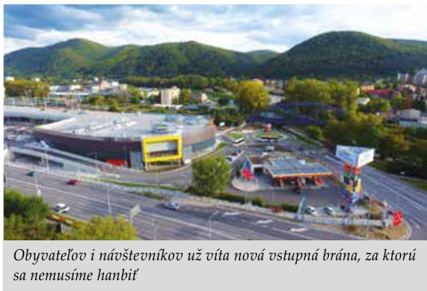
Obyvateľov i návštevníkov už víta nová vstupná brána, za ktorú sa nemusíme hanbiť