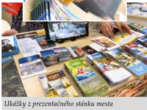
Ukážky z prezentačného stánku mesta

ujem o architektka Ladislava Hudeca, ktorý sa preslávil stavbou prvej výškovej budovy v Šanghaji. Park Hotel s 22. poschodiami bol dlhé desaťročia aj najvyššou budovou Ázie. Skúsenosti z veľtrhov nám ukazujú, že turisti už nejavia len záujem o pamiatky a možnosti relaxu v meste. Najmä mladých ľudí lákajú viacdnové podujatia medzinárodného charakteru (SIAF, Outbreak Europe, United jazz festival, Streetfood