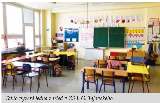
Takto vyzerá jedna z tried v ZŠ J. G. Tajovského