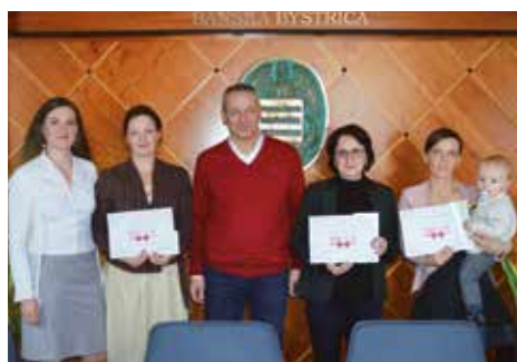
Výťažok si prevzali zástupkyne jednotlivých centier osobne

Činnosť komunitných centier nemá prioritne charitatívny zámer. Tendenciou však je, aby sa aj pre ohrozené skupiny obyvateľov vytváral priestor na sebarealizáciu. Mesto Banská Bystrica má záujem podporovať komunitný rozvoj a zapájať ľudí do diania. Vedenie mesta sa stretáva so zástupcami komunitných centier