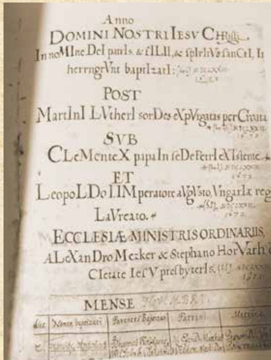
Titulná strana najstaršej matriky Španej Doliny