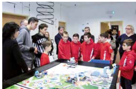
Regionálne kolo FIRST LEGO league

Amatérski vedci a konštruktéri zo základných a stredných škôl v regióne sa tento rok popasovali s úlohami na tému Hydro Dynamics, teda ako vodu nájsť, prepravovať, používať a zlikvidovať. Súťaž pozostávala zo štyroch rovnocenne hodnotených častí – Robot Design, tímová práca, prezentácia výskumného projektu a Robot Game. Víťazný tím z jednotlivých regionálnych kôl postupuje na celosvetové finále v poľskom Lodži.