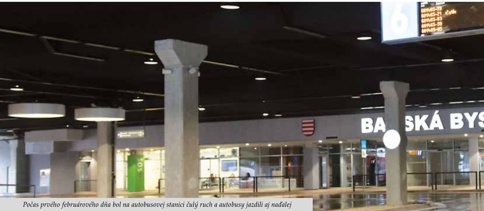
Počas prvého februárového dňa bol na autobusovej stanici čulý ruch a autobusy jazdili aj naďalej

Za posledné obdobie si mohol každý Banskobystričan prečítať mnoho príbehov o autobusovej stanici, poskladaných väčšinou z nepravdivých a zavádzajúcich informácií. Búrľivá diskusia sa rozprúdila na sociálnych sieťach i v médiách okamžite potom, ako vedenie mesta oznámilo, že autobusovú stanicu nakoniec neodkúpi. Kto zneužil pozitívne mienenú informáciu a postavil samosprávu do pozície nedôveryhodného partnera? Čitateľovi prinášame chronologický prehľad strategických rozhodnutí týkajúcich sa vstupnej brány do Banskej Bystrice. Možno v nich nájde odpovede na často diskutované otázky.