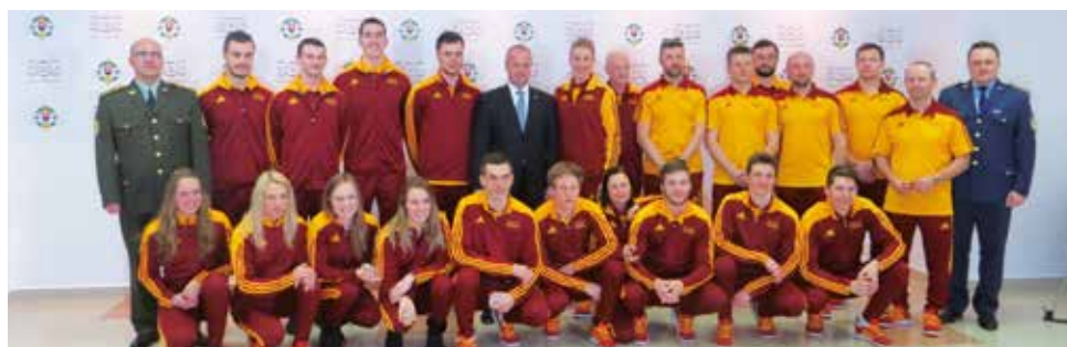
Naši reprezentanti pred odchodom na olympijské hry