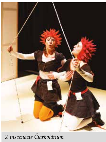
Z inscenácie Čiarkolárium

Je venovaná HMATU, jednému zo základných ľudských zmyslov, s ktorým prichádzame do styku veľmi skoro. Na základe hmatových vnemov, obja-